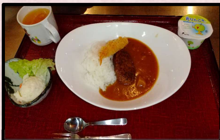
お子様ハンバーグカレー (ドリンクバー・おもちゃ付) 1,100円