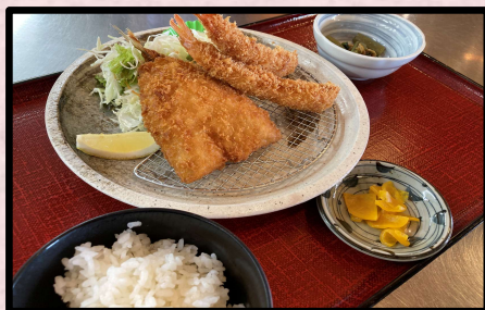
アジ&エビフライ定食 1,380円