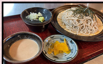
おすすめ くるみそば 1,420円 (東御産くるみ使用 うどん変更不可)