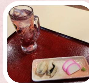
湯上がりセット (男梅サワー)