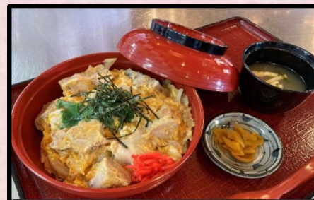
おすすめ 福味鶏親子丼 1,380円