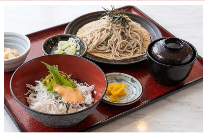
おすすめ ざるしら(ざるそばとミニしらす丼) 1,730円 ・ご飯大盛り +100円・麺大盛り +400円 ※うどん変更でも金額は一緒となります