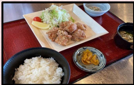
おすすめ 鶏から揚げ定食 (数量限定)