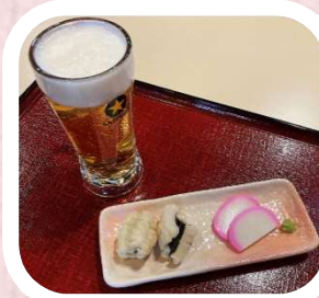
湯上がりセット (生ビール中)