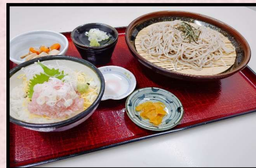
おすすめ ざるネギ (ざるそばとミニネギトロ丼) 1,730円