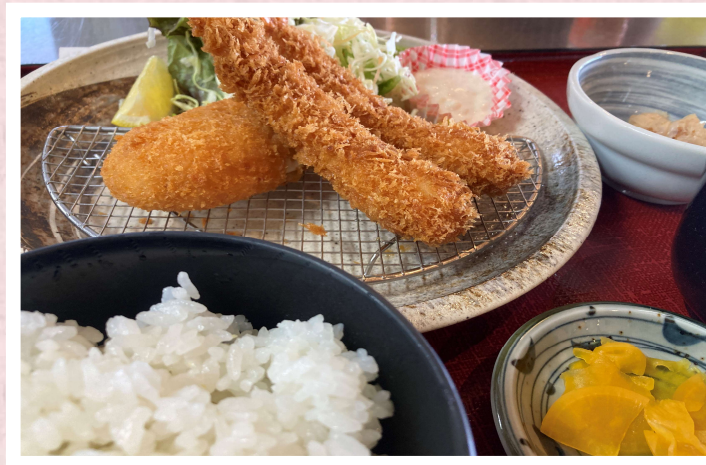
おすすめ エビフライ&カニクリームコロッケ定食 1,380円