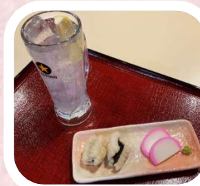
湯上がりセット (レモンサワー)