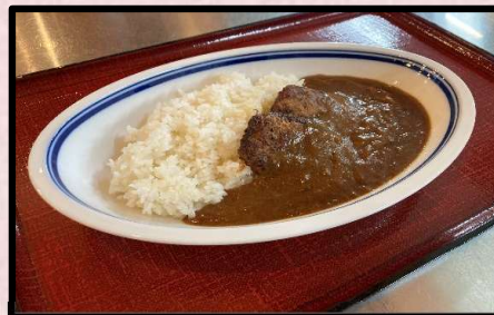
ハンバーグカレー 1,280円