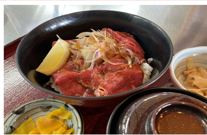
厳選ローストビーフ使用 おすすめ ローストビーフ丼 1,880円