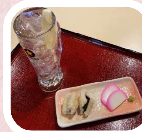
湯上がりセット (ハイボール)