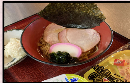
ちびっこラーメン (ドリンクバー・おもちゃ付) 1,100円