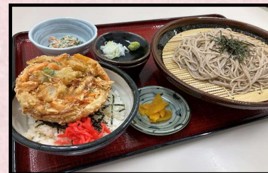
おすすめ ざるしら (ざるそばとミニしらす丼) 1,730円