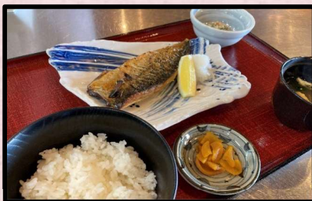
トロサバ塩焼き定食 1,280円