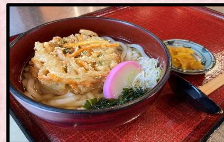
かき揚げうどん 1,130円