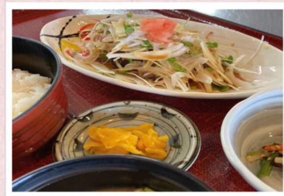
春夏の定番メニュー! かつおのたたき定食 1,380円