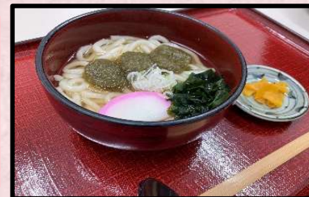
とろろ昆布うどん 940円