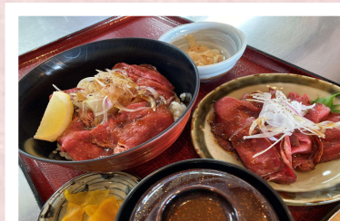
ローストビーフが! 倍に! ローストビーフ丼ダブル 2,800円